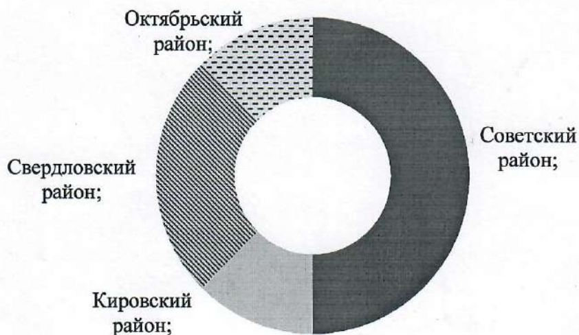
Диаграмма команд, вышедших в финал, в разбивке по районам.